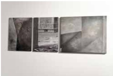
zdjęcia z wystawy w mia ART GALLERY / pictures from exhibition in mia ART GALLERY