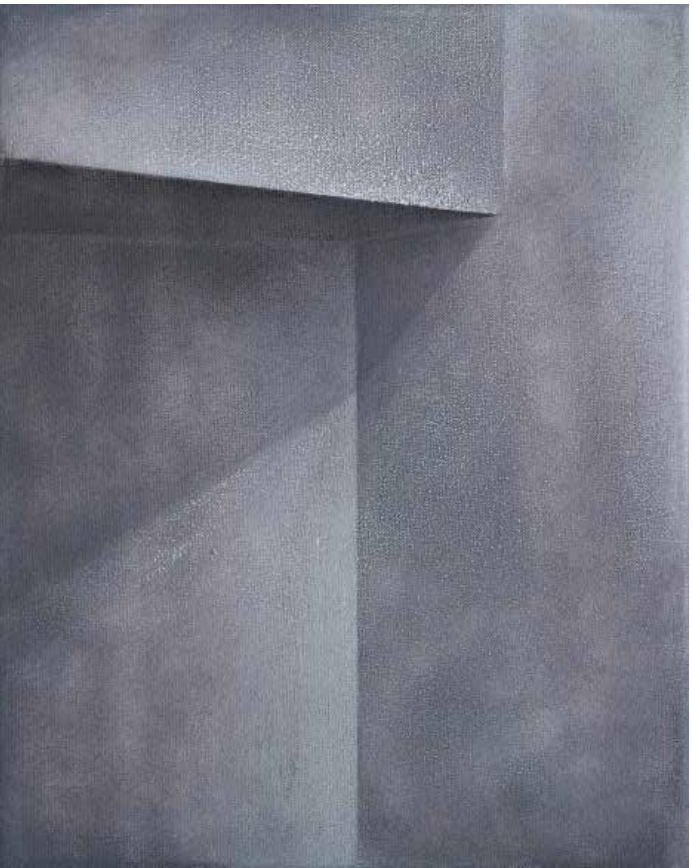
Lukasz Huculak - Sufr V , 30 x 24 cm, tempera na płótnie, 2017 / Ceiling V , 30x24 cm, distemper on canvas, 2017