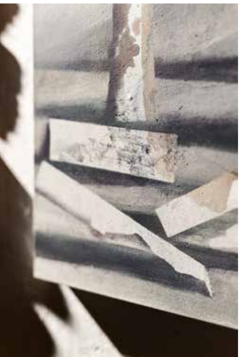
zdjęcia z wystawy w mia ART GALLERY / pictures from exhibition in mia ART GALLERY