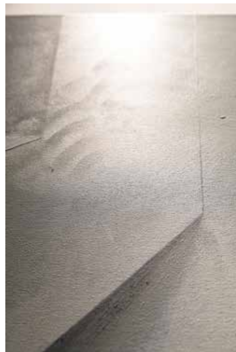
zdjęcia z wystawy w mia ART GALLERY / pictures from exhibition in mia ART GALLERY