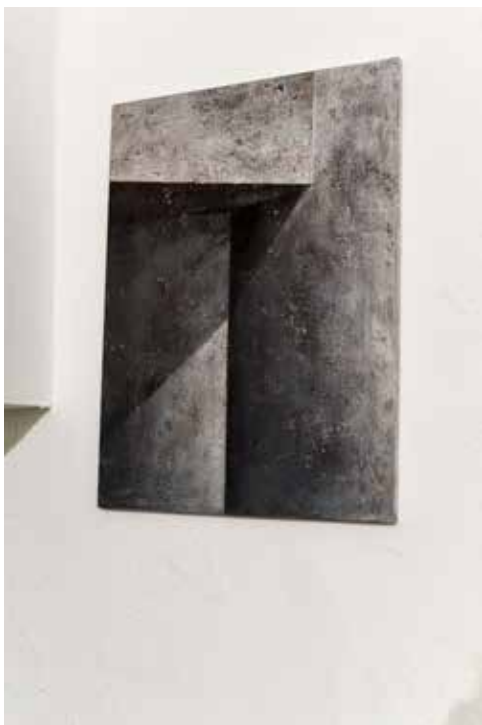
zdjęcia z wystawy w mia ART GALLERY / pictures from exhibition in mia ART GALLERY