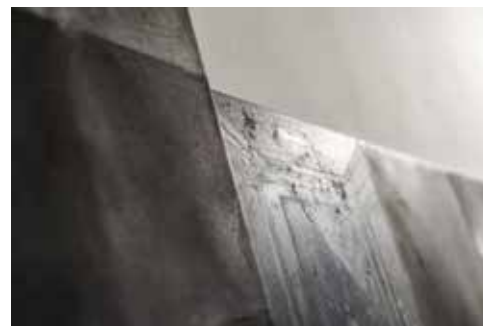
zdjęcia z wystawy w mia ART GALLERY / pictures from exhibition in mia ART GALLERY