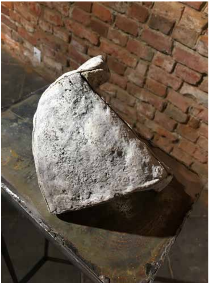
Magda Grzybowska, Scany 1, 20 x 10 x 17 cm, szamot, angobry, lenki, 2017 / Welis 1, 20x10x17 cm, fireclay, engobes, oxides, 2017

Przemieszanu ulegają także przypisane poszczególnym dyscyplinom właściwości - trudno nie dostrzec przestrzennych ambicji malarstwa skrywających się w modelunku światłocieniowym i fakturze, architektoniczności konstruktywizmu. Kwestie figury i proporcjonalności wydobywa tonalność obrazu - ograniczona gama. Przy wzroście precyzji operowania stosunkami walorowymi wznoszą problemy kompozycyjne - mocne kontrasty zaginają kierunki (entazis) na zasadzie ekspansji światła i zapadania się cieni. Z drugiej strony, problem malarskości rzeźby nie spoczywa wyłącznie w kolorze, lecz także w fakturalności płaszczyzny lub zmienności obrazowej perspektywy. Malarski może być sam kształt, a zwłaszcza jego usytuowanie wobec ła.