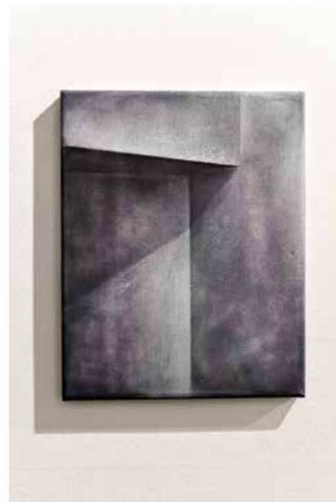
zdjęcie z wystawy w mia ART GALLERY / pictures from exhibition in mia ART GALLERY