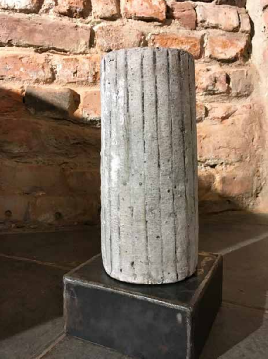
Magda Grzybowska, Kolumny , średnica 15 cm, wys 35 cm, szamot, angoby, tlenki, 2017 / Columns , diameter 15cm, heigh 35 cm, fireclay, engobes, oxides, 2017