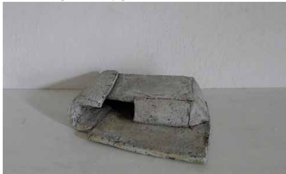
Magda Grzybowska, Szkic-budowla , 25 x 20 x 15 cm, szamot, angoby, tlenki, 2017 Sketch - building , 25 x 20 x 15 cm, fireclay, engobes, 2017

Tak rozumiana mobilność zdaje się spoczywać u źródła twórczości, czy to jako projekcja wyobrażeń autora, czy też jako transfer fragmentu rzeczywistości na przedmiot sztuki. W jej obrębie migracja trwa nadal, jedne pomysły generują inne, formy wpływają na siebie nawzajem, idee, spotkawszy na swej drodze obce, ewoluują w kolejne.