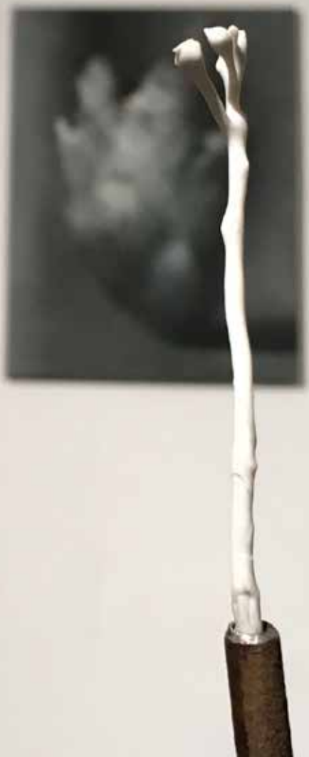
Magda Grzybowska Zyrandol (detail), 45 x 45 x 200 cm, stal, porcelana, 2017 / Chandelier (detail), 45x45x200 cm, steel, porcelain, 2017