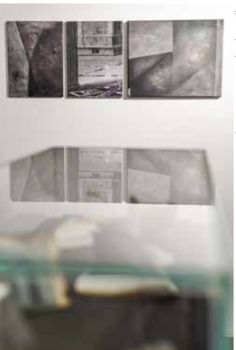
zdjęcia z wystawy w mia ART GALLERY / pictures from exhibition in mia ART GALLERY