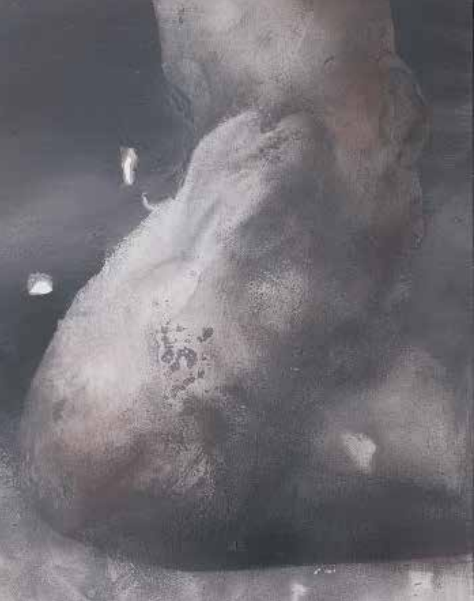
Lukasz Huculak - Chupa, 40 x 30 cm, tempera na desce, 2016 / Splash, 40x30 cm, distemper on panel, 2016