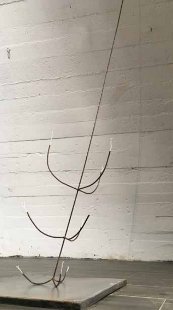
Magda Grzybowska. Zyrandol. 45 x 45 x 200 cm. stal, porcelana. 2017 / Chandelier. 45x45x200 cm. steel, porcelain. 2017