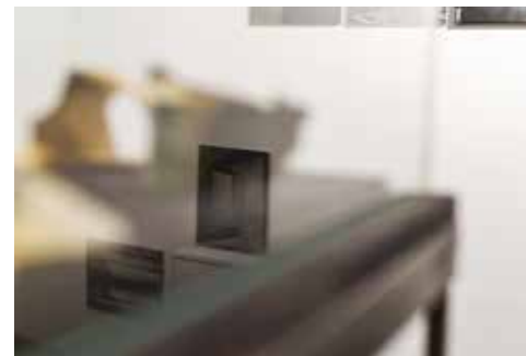
zdjęcia z wystawy w mia ART GALLERY / pictures from exhibition in mia ART GALLERY

The early Renaissance, so very modern through its "hybrid" attitude to the plane (spatial modelling embedded in architectural abstraction and ornamental geometry), becomes intuitive "constructivism". Architecture as a point of reference for painting and sculpture - and these disciplines, in turn, as an architectural model - is a concept that sealed the victory of modernism. The charm of paintings by medieval primitives, resulting from the perspectivist disturbances, which in El Lissitzky's works are a conscious game. According to George Berkeley, the cube does not exist, it is a plane: to the sharpened senses, its edge will appear as wide, because "even if we allow for the existence of matter, it may be no larger than the head of a pin" (George Berkeley, Dzienniki Filozoficzne [Philosophical Journals], p. 26).