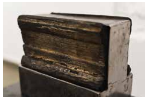
zdjęcia z wystawy w mia ART GALLERY / pictures from exhibition in mia ART GALLERY