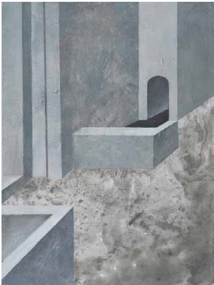
Łukasz Huculak, Brama , 40 x 30 cm, tempera na desce, 2017 / Gate , 40x30 cm, distemper on panel, 2017