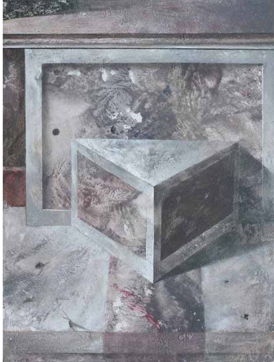
Łukasz Huculak, Marmur , 40 x 30 cm, tempera na desce, 2016 / Marble , 40x30 cm, distemper on panel, 2016