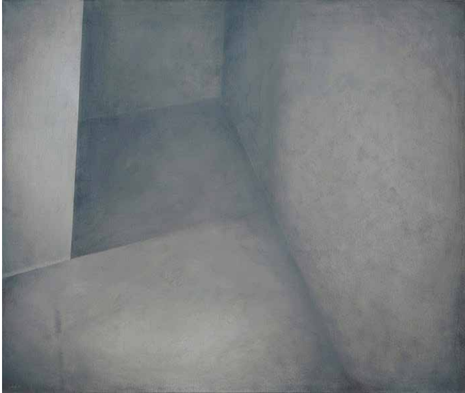
Łukasz Huculak Sufit , 110 x 130 cm, olej na płótnie, 2014 / Ceiling , 110x130 cm, oil on canvas, 2014