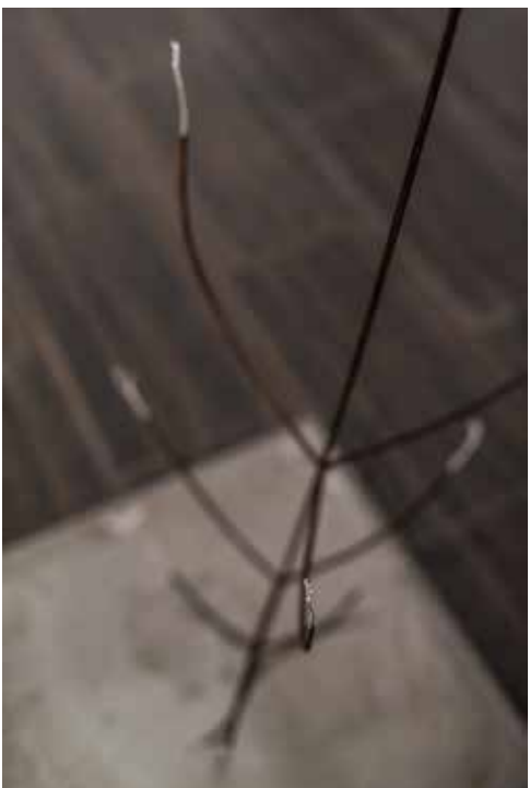
zdjęcia z wystawy w mia ART GALLERY / pictures from exhibition in mia ART GALLERY