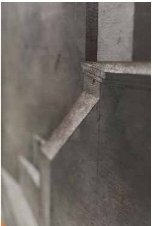
zdjęcia z wystawy w mia ART GALLERY / pictures from exhibition in mia ART GALLERY