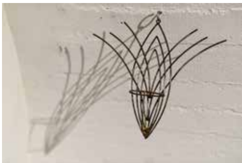
zdjęcia z wystawy w mia ART GALLERY / pictures from exhibition in mia ART GALLERY

not necessarily fitting into the concept of sculpture. Her works include sculpted objects, as well as film, photography, light phenomena, situations, gestures and movements. Since 2006, she has been working as a teacher at the Academy of Fine Arts in Wrocław. In 2011, she received her doctorate in fine arts.