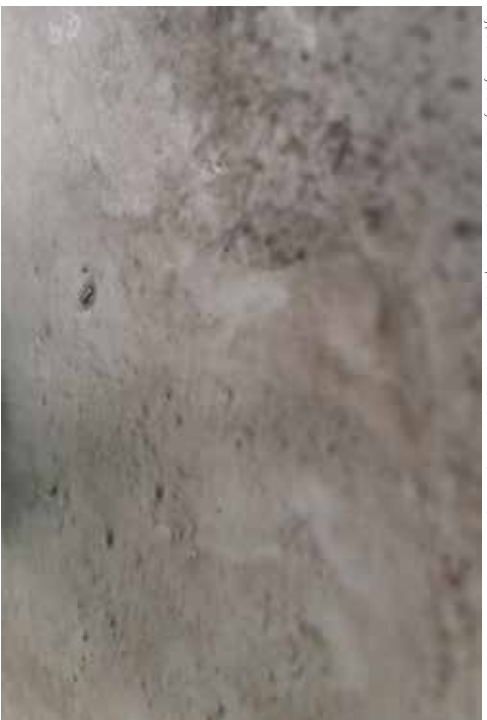
zdjęcia z wystawy w mia ART GALLERY / pictures from exhibition in mia ART GALLERY