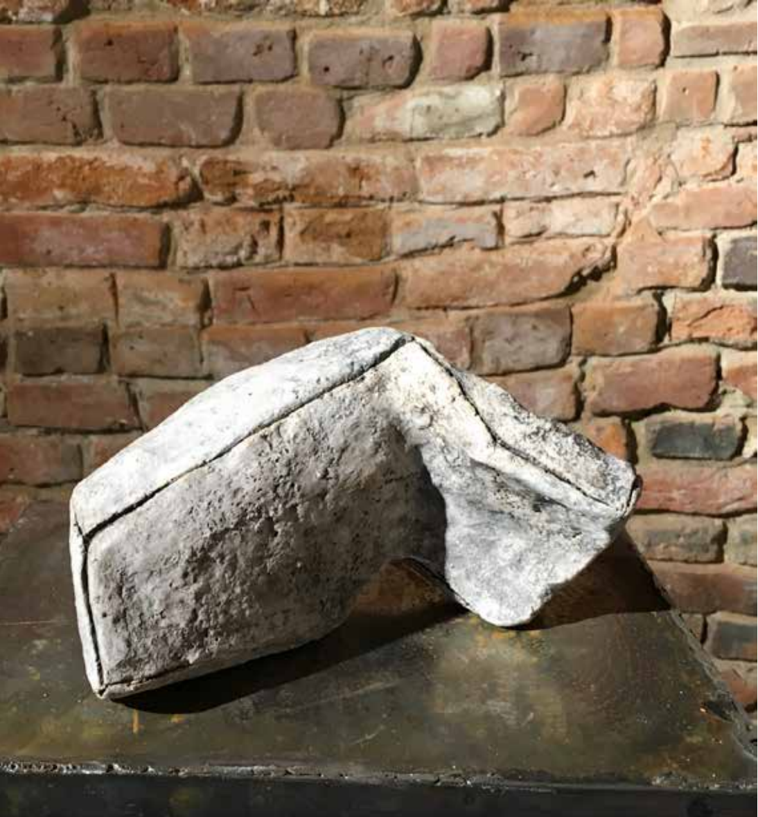
Magda Grzybowska, Ściany /I/ szamot, angoby, hienki / Walls /I/ freckly engobes, oxides , 2017