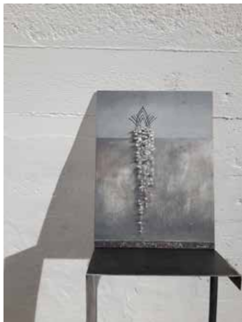
zdjęcia z wystawy w mia ART GALLERY / pictures from exhibition in mia ART GALLERY