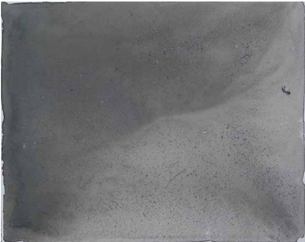
Lukasz Huculak, Podloga , 24 x 30 cm, tempera na desce, 2017 / Floor , 24x30 cm, distemper on panel, 2017