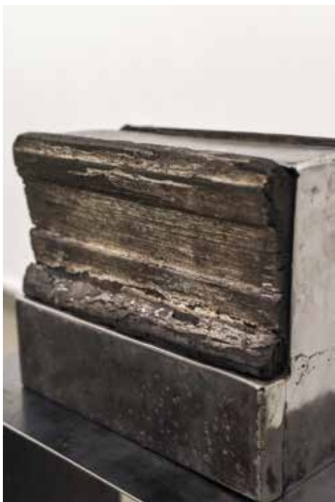
zdjęcia z wystawy w mia ART GALLERY / pictures from exhibition in mia ART GALLERY