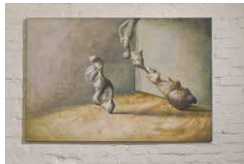
zdjęcia z wystawy w mia ART GALLERY / pictures from exhibition in mia ART GALLERY