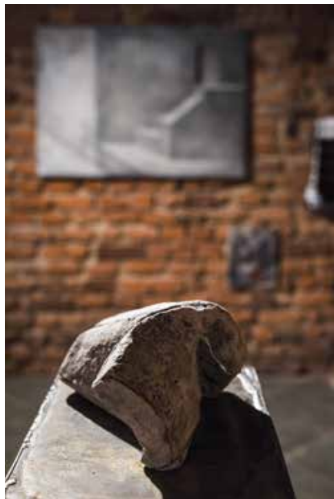
zdjęcia z wystawy w mia ART GALLERY / pictures from exhibition in mia ART GALLERY