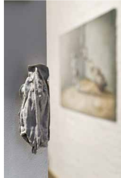
zdjęcia z wystawy w mia ART GALLERY / pictures from exhibition in mia ART GALLERY