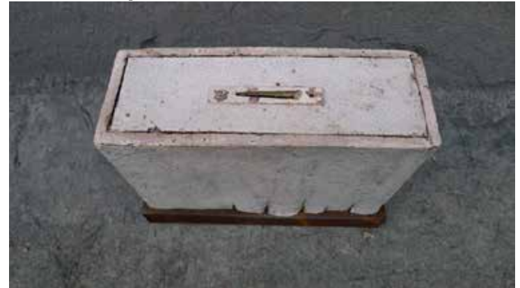
Magda Grzybowska. Skrzynka. 25 x 10 x 17 cm, szamot, szkliwo, tlenki, angoby, 2017 / Case. 25x10x17, fireclay, engobes, oxides, 2017