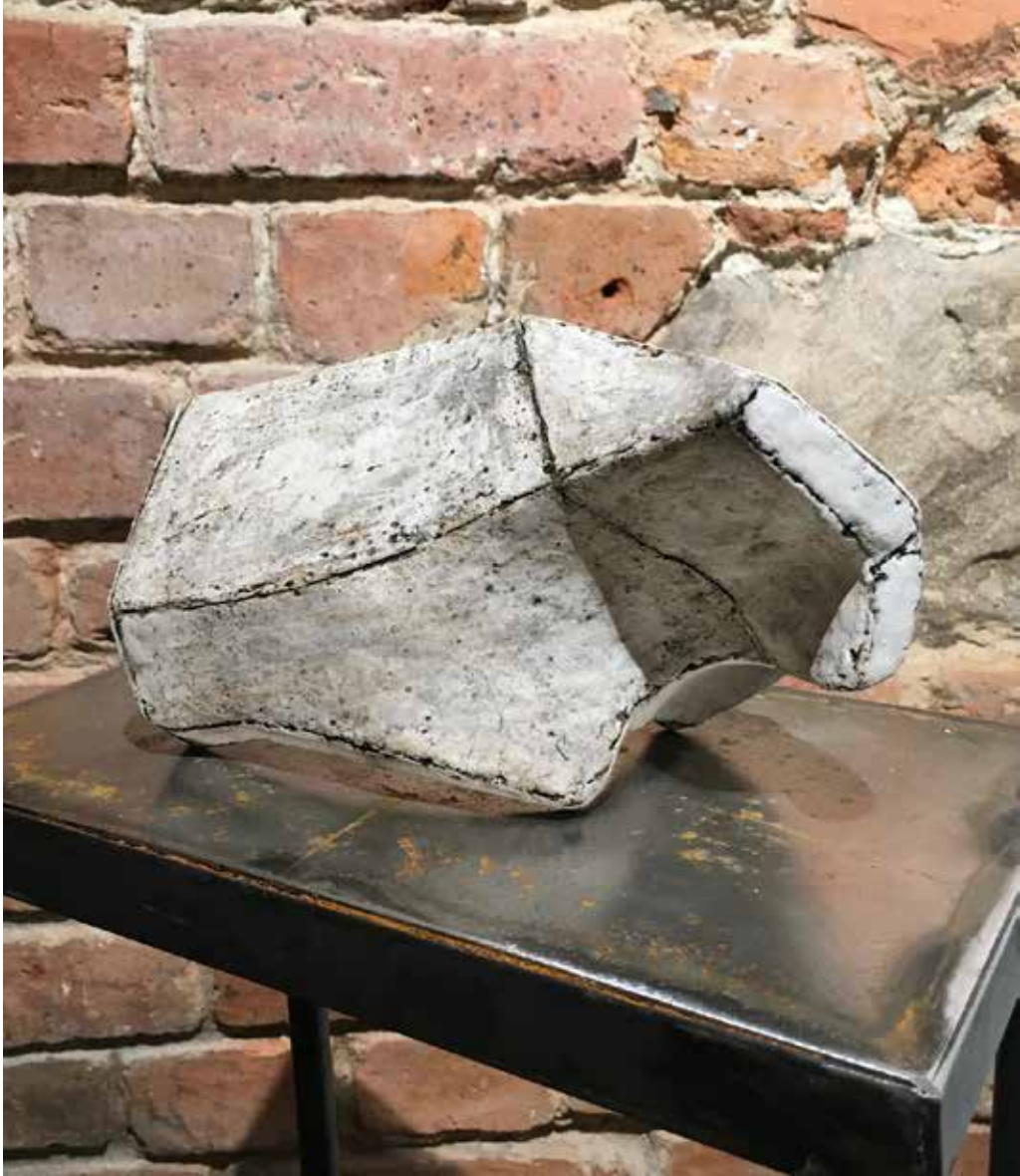
Magda Grzybowska, Ściany II , szamot, angoby, tlenki / Walls II, recycled engobes, oxides, 2017