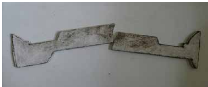
Magda Grzybowska, Motyw , 35 x 7 x 1 cm, szamot, angoby, tlenki, szkliwo, 2017 Motive , 35x7x1 cm, fireclay, engobes, oxides, enamel, 2017