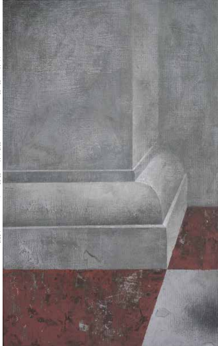
Łukasz Huculak, Moroni , 80 x 50 cm, tempera na desce, 2017 / Moroni , 80x50 cm, distemper on panel, 2017