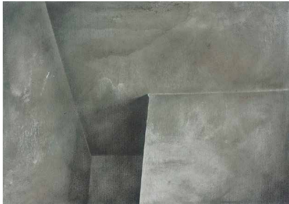
Łukasz Huculak Sufit I , 50 x 70 cm, tepera na desce, 2014 / Ceiling I , 50x70 cm, distemper on panel, 2014

Siłą rzeczy jest to więc wystawa o przestrzeni, której skuteczne modelowanie zależne jest nie tyle od nieruchomej kontemplacji, co od zdolności jej powiązania z przemieszczeniem (migracją). Hołd dla doznania rozciągłości: dla architektury, i tego, czym ją wypełniamy. Pojęciem kluczowym wydaje się być sztafaż - dodając lub ujmując detale zmieniamy krajobraz stworzony z kierunków, płaszczyzn, głębi i wypukłości. Surowość Le Corbusiera, wierzącego wzorem Palladia w możliwość zakłęcia piękna w relacji wysokość-szerokość-głębokość i liryzm Hammershoi (duńskie hygge ), perspektywy Saenredama wpisane w architekturę El Lissitzkiego. Próbuje się zrozumieć, skąd wzięła się geometria, jaki jest związek bryły z jej wnętrzem, i z perspektywą