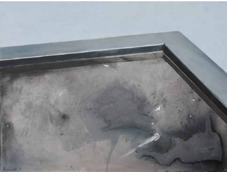
Lukasz Huculak, Basen , 30 x 40 cm, tempera na desce, 2016 / Pool , 50x70, distemper on panel, 2014

- malarskim ekwiwalentem trójwymiarowości. Idąc dalej: jaka relacja łączy widzialne i dotykalne?