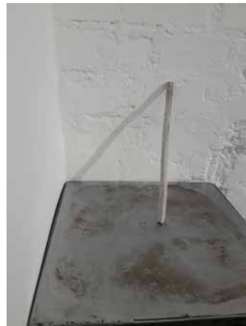
zdjęcia z wystawy w mia ART GALLERY / pictures from exhibition in mia ART GALLERY