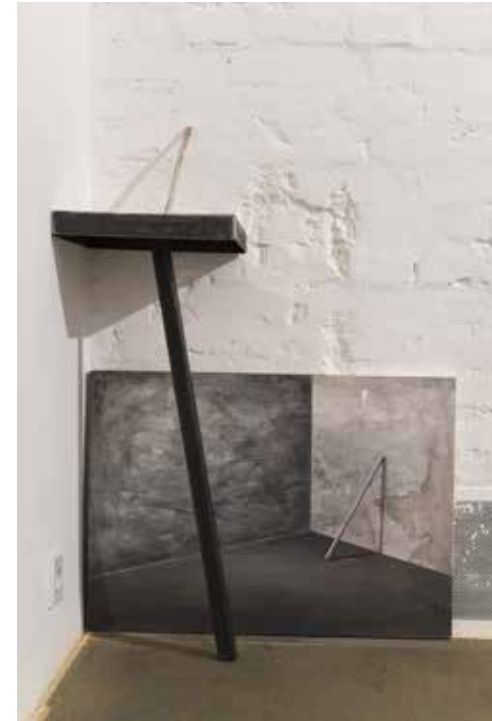
zdjęcia z wystawy w mia ART GALLERY / pictures from exhibition in mia ART GALLERY