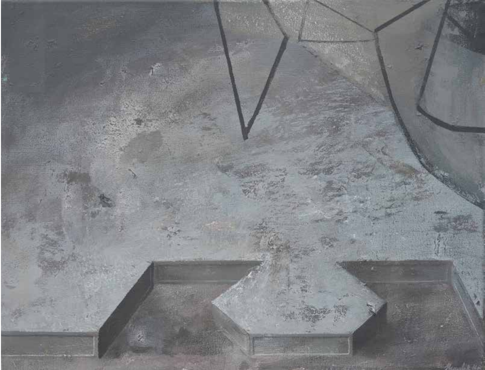
Lukasz Huculak, Podloga III , 40 x 60 cm, tempera na desce 2016 / Floor III , 40x60 cm, distemper on panel, 2016