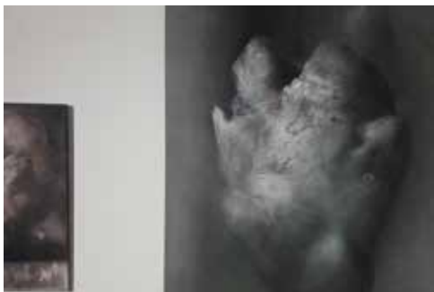
zdjęcia z wystawy w mia ART GALLERY / pictures from exhibition in mia ART GALLERY