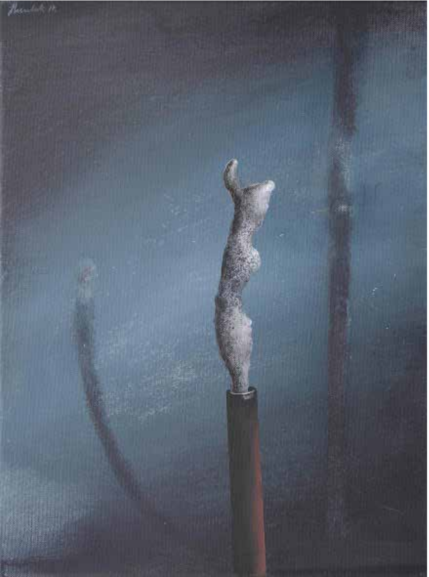
Lukasz Huculak, MG, 40 x 30 cm, tempera na płótnie, 2017 / MG, 40x30 cm, distemper on canvas, 2017