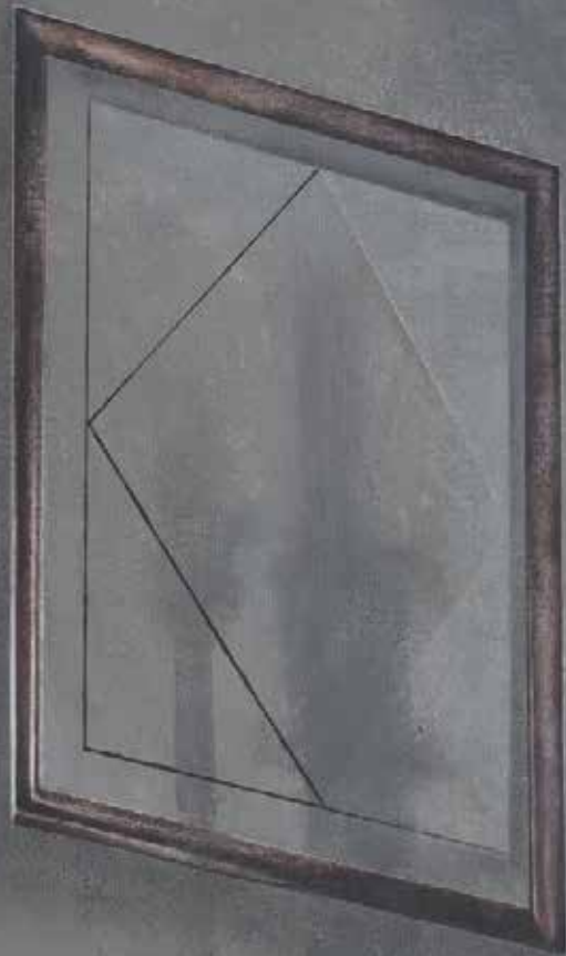
Lukasz Huculak, Teatr 65 x 50 cm, tempera na płótnie 2017 / The Theatre 65x50 cm distemper on canvas, 2017