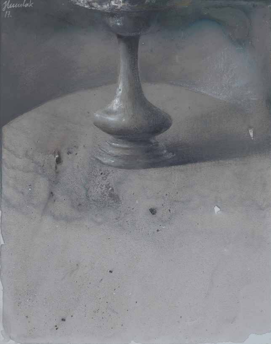
Lukasz Huciak, Fountain, 30 x 24 cm, tempera na desce, 2017 / Fountain, 30x24 cm, distemper on panel, 2017