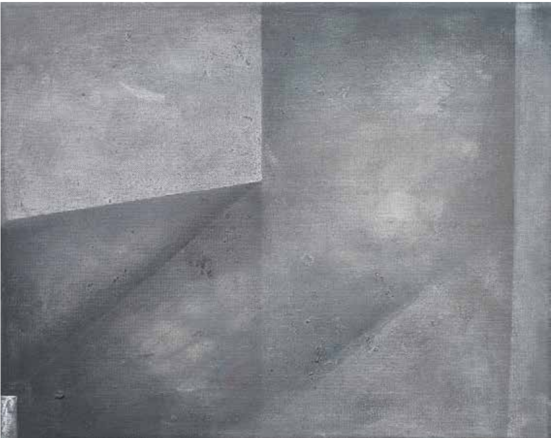
Lukasz Huculak - Sufr III , 40 x 50 cm, tempera na płótnie, 2016 / Ceiling III , 40x50 cm, distemper on canvas, 2016